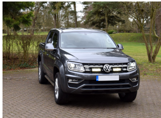
VW AMAROK V6 2016+