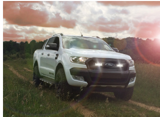
FORD RANGER 2016+