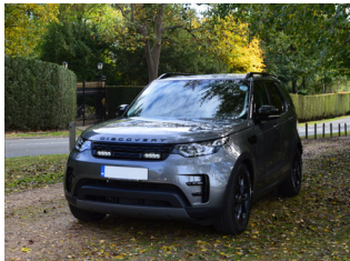
DISCOVERY 5 2018+