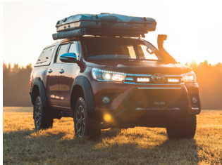
TOYOTA HILUX 2017+